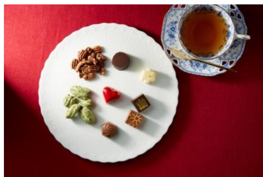
お茶やコーヒーなどと一緒に素敵なひと時を。