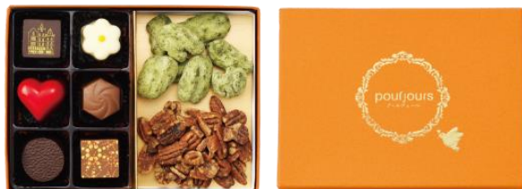
「大人のベストセクション 2020」

また、「バレンタインボンボンショコラ」(6個入り 税込価格 1,900円/10個入り 税込価格 2,800円)と「柚子のピールチョコレート」(70g 税込価格 1,700円)も同日1月21日(火)に発売いたします。