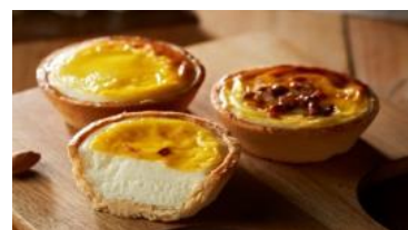
北海道産チーズを100%使用 「ちーずたると」(1個税込 250円)