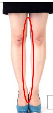
ストッキングなし