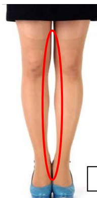
tepap (テパップ) ストッキング