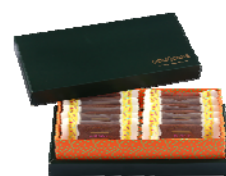
10 枚入 ¥2,500