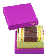
5 枚入 ¥1,300

カカオを練り込んだショコラサブレにブラックペッパーを おりませたプルジュールオリジナルのサブレ生地。 カカオやフルーツの味と香りを溶け込ませた チョコレートクリームのかくと甘さにアクセントをきかせた、 記憶に残るサブレです。