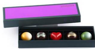
5 個入 ¥2,000 (フルーツライヴ 5 種)