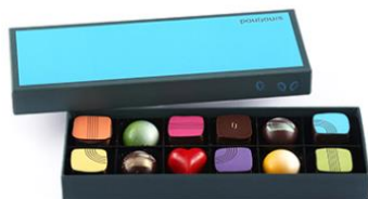
12 個入 ¥4,300 (カラーライン7種+フルーツライヴ5種)