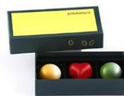
3 個入 ¥1,300 (カシス、レモン・ゼスト、 ブラリネ・ベルガモット)