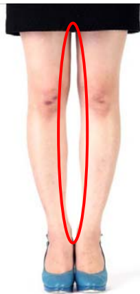
ストッキングなし